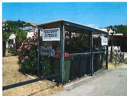
Lokacija: začetek pomola v pristanišču Portorož

Mešane komunalne odpadke, ločene frakcije in odpadne fekalne vode prevzema naše podjetje, ki je v občini Piran izvajalec obvezne občinske javne službe ravnanja z odpadki.