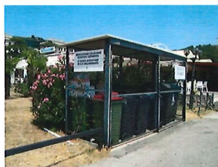
Sito: alla radice del molo del porto di Portorose

I rifiuti urbani misti, le frazioni di rifiuti e le acque nere sono ritirati dalla nostra azienda, che esegue il servizio di smaltimento dei rifiuti nel Comune di Pirano.