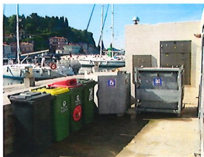
Lokacija 2: glavni pomol (ob sanitarijah)

Mešane komunalne odpadke, ločene frakcije in odpadne fekalne vode prevzema naše podjetje, ki je v občini Piran izvajalec obvezne občinske javne službe ravnanja z odpadki.