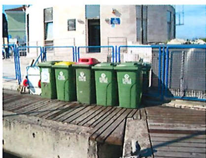
Lokacija 1: vstop v pristanišče