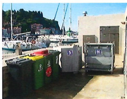
Sito 2: molo principale (accanto ai servizi igienici)

I rifiuti urbani misti, le frazioni di rifiuti e le acque nere vengono ritirati dalla nostra azienda, che è l'esecutrice nel comune di Pirano del servizio di smaltimento dei rifiuti.