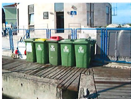
Sito 1: ingresso del porto