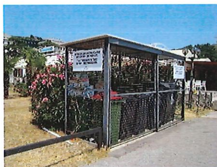
Lokacija: začetek pomola v pristanišču Portorož

Mešane komunalne odpadke, ločene frakcije in odpadne fekalne vode prevzema naše podjetje, ki je v občini Piran izvajalec obvezne občinske javne službe ravnanja z odpadki.