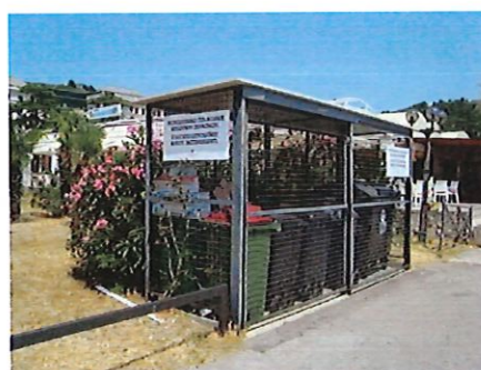
Sito: alla radice del molo del porto di Portorose

I rifiuti urbani misti, le frazioni di rifiuti e le acque nere sono ritirati dalla nostra azienda, che esegue il servizio di smaltimento dei rifiuti nel Comune di Pirano.