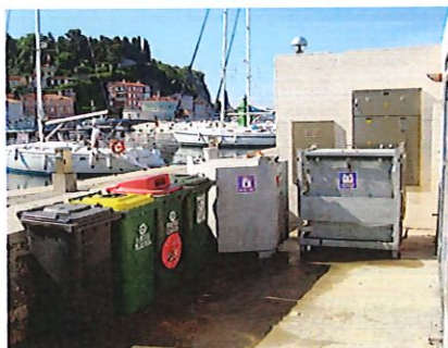
Lokacija 2: glavni pomol (ob sanitarijah)

Mešane komunalne odpadke, ločene frakcije in odpadne fekalne vode prevzema naše podjetje, ki je v občini Piran izvajalec obvezne občinske javne službe ravnanja z odpadki.