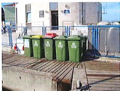
Lokacija 1: vstop v pristanišče