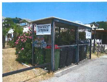
Lokacija: začetek pomola v pristanišču Portorož

Mešane komunalne odpadke, ločene frakcije in odpadne fekalne vode prevzema naše podjetje, ki je v občini Piran izvajalec obvezne občinske javne službe ravnanja z odpadki.