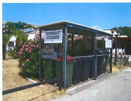
Sito: alla radice del molo del porto di Portorose

I rifiuti urbani misti, le frazioni di rifiuti e le acque nere sono ritirati dalla nostra azienda, che esegue il servizio di smaltimento dei rifiuti nel Comune di Pirano.