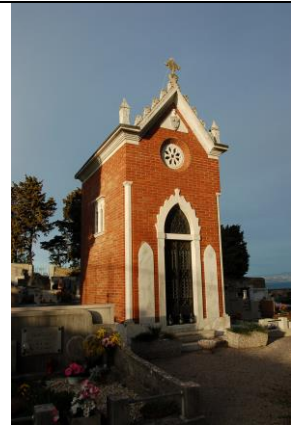
Kapela družine de Castro