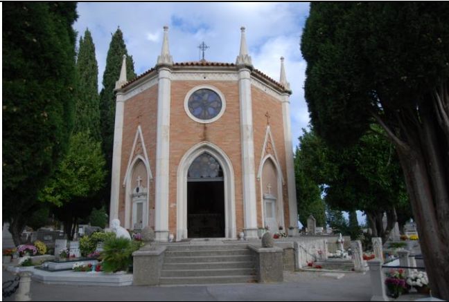
Pokopališka cerkev sv. Mohorja in Fortunata