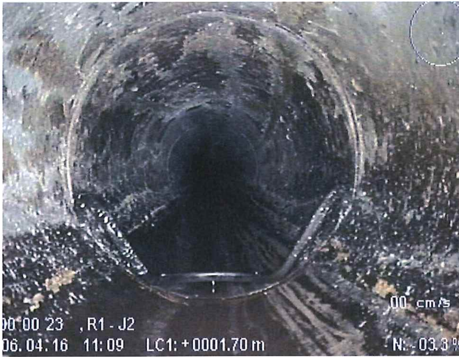
Poškodovana ležišča tesnil , obrušene stene